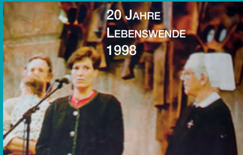
20 JAHRE LEBENSWEDE 1998