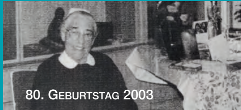
80. GEBURTSTAG 2003