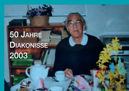
50 JAHRE DIAKONISSE 2003