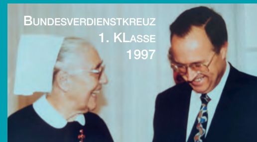
BUNDESVERDIENSTKREUZ 1. KLASSE 1997