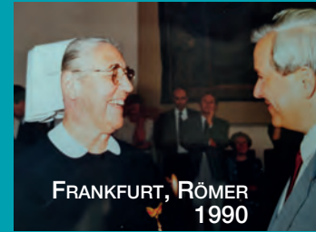
FRANKFURT, RÖMER 1990